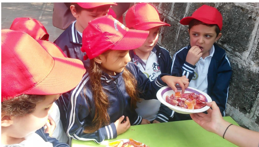
Orangenverkostung in Maletto auf Sizilien.

Schwerpunkt des Projekts ist eine erlebnis- und aktionsreiche Bildung von Kindern, die Gärtnern und Bauernhofbesuche einschließt. Darüber hinaus fördert das Projekt den Direktverkauf von Feldfrüchten durch die Organisation von Bauernmärkten und den Ab-Hof-Verkauf. Zur Qualitätssicherung und der Förderung einer umweltfreundlichen und artenreichen Landwirtschaft werden Kriterien für eine Regionalmarke entwickelt. In alle Aktivitäten sind junge Volontäre aus dem (ost) europäischen Ländern eingebunden, die Gelerntes später als Multiplikatoren in ihren Heimatländern einsetzen können.